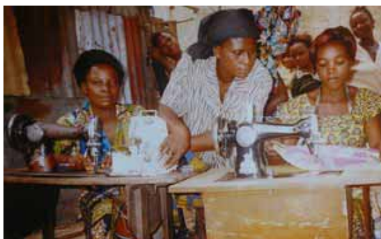
Photo de l'atelier de couture commencé en 2008